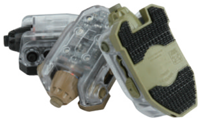
제품 본체 + AA 배터리