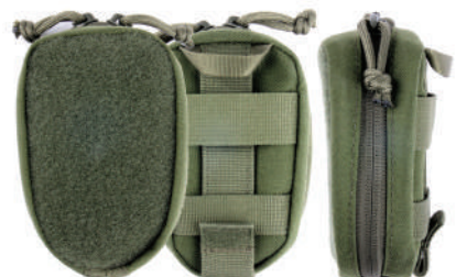
몰리방식 전용 파우치