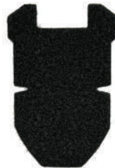
헬멧 부착용 예비 벨크로